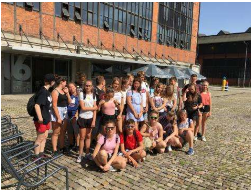
Tercie v U6