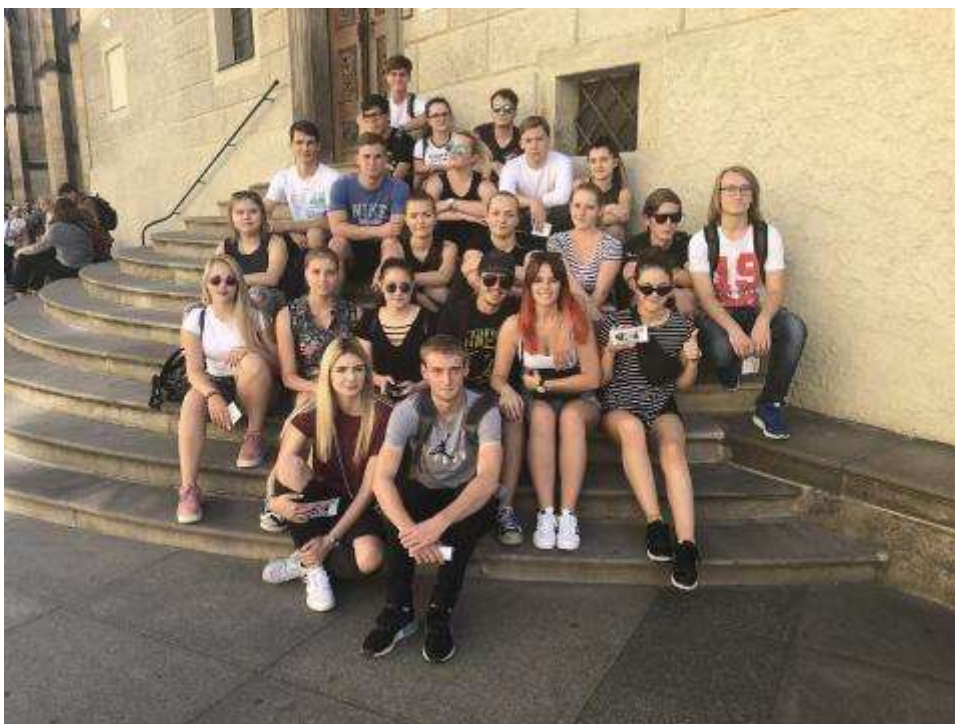
Maturanti v Praze