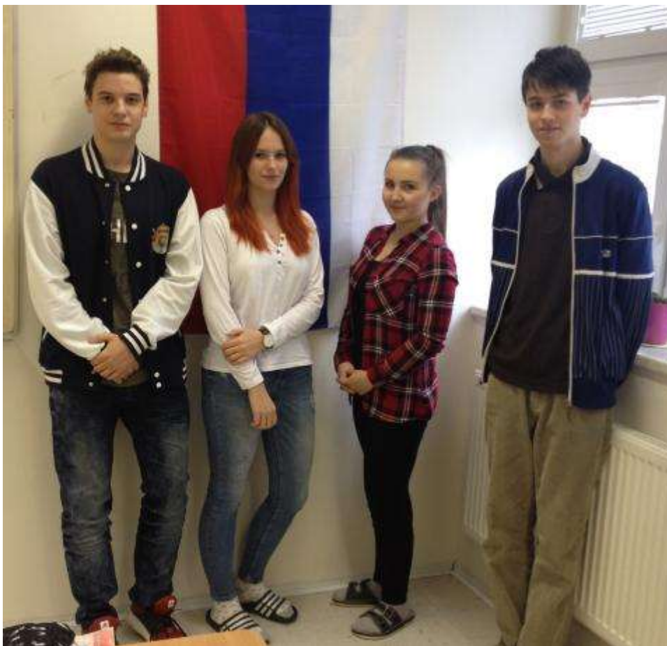
Možná to budou překladaelé...

Všichni postoupili do univerzitního kola, které se konalo na Filozofické fakultě UP v Olomouci.