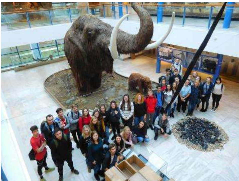
Brno - Anthropos

- každoročně opakovaná exkurze do brněnského Anthroposu. Na programu měly obě třídy komentovanou prohlídku stálé expozice Pavilonu Anthropos, výstavu obrazů "Zápas ichtyosaurů aneb pravěk štětcem Zdeňka Buriana".