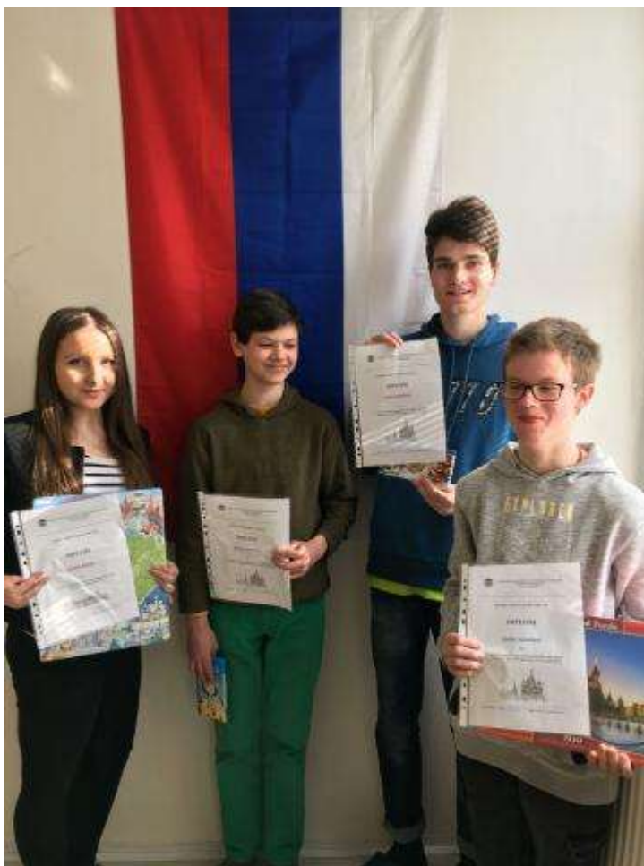
Vítězové jednotlivých kategorií