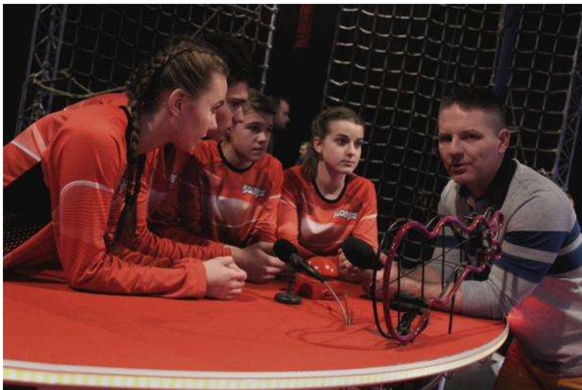
V televizním Bludišti