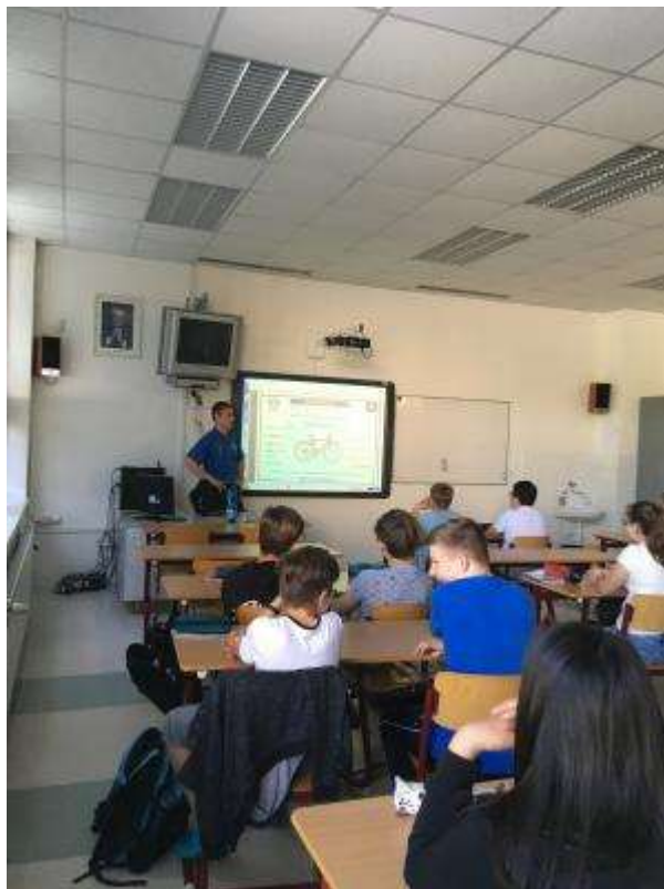
Prevence v sekundě