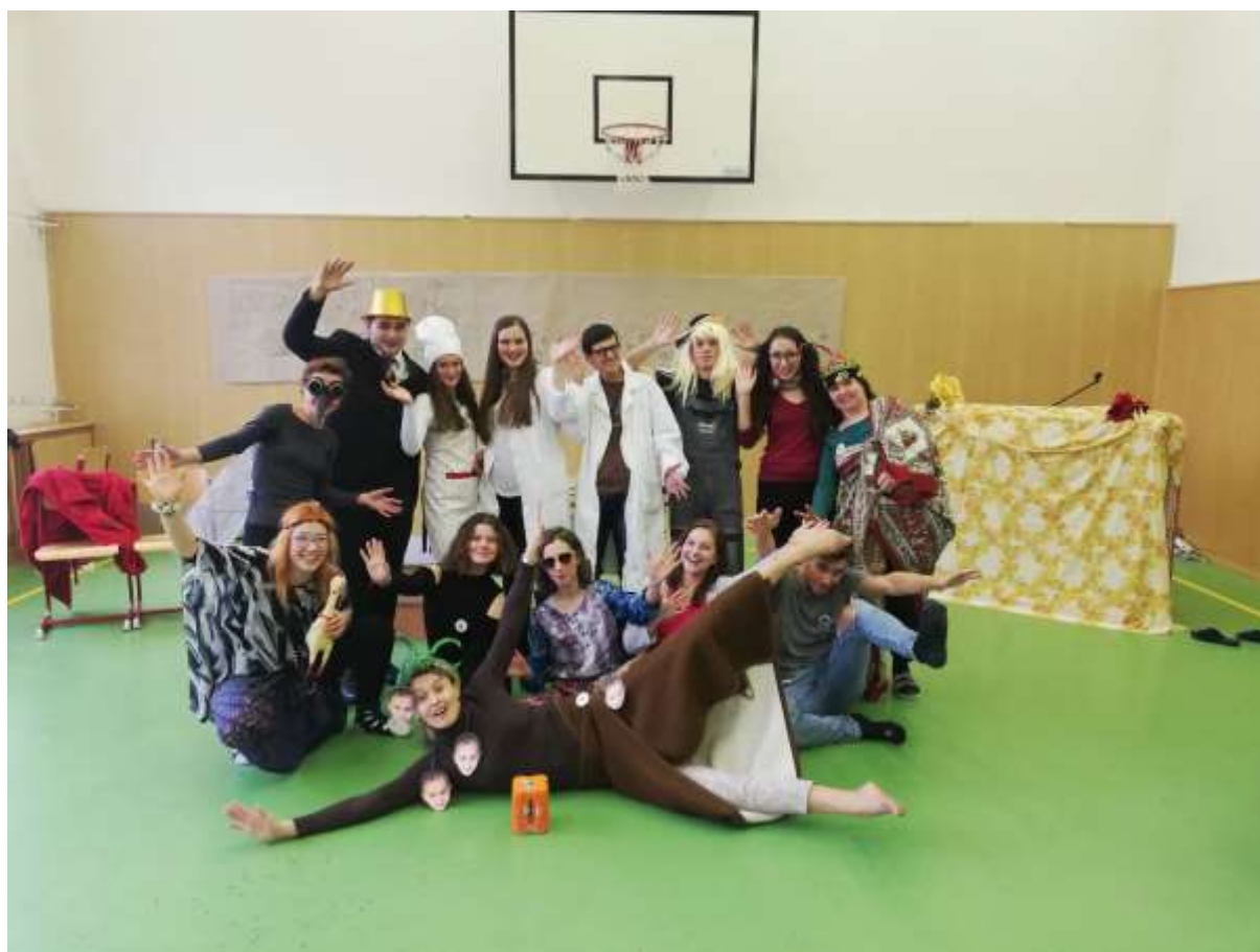
Divadlo „Keňa není růžová“ na motivy Šípkové Růženky a v podání septimy

Vzhledem k tomu, že v letošním roce probíhá rekonstrukce Sokolovny Kojetín, uskutečnil se místo tradiční akademie v tělocvičně školy předvánoční projektový den. Akce se uskutečnila v průběhu dne a současně probíhaly i třídní vánoční besídky. Divadelní představení se hrálo dvakrát pro nižší a vyšší gymnázium. Střední část byla věnována vyhodnocování soutěží, slavnostním proslovům a společnému zpěvu tříd. V úvodu se představil třemi písněmi sbor Prima nota. Celá akce měla spontánní charakter a neopakovatelnou atmosféru, která byla umocněna mírně stísněným prostorem zmíněné tělocvičny. To lze ale možná spíše považovat za prvek pozitivní. Do akce se zapojily všechny ročníky a výrazně také nejmladší primáni. Úspěch mělo i divadelní představení v provedení septimy a k úspěchu přispělo i zapojení několika vyučujících.