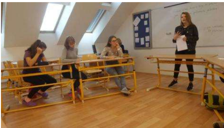
Prváci se učili debatovat

Díky tomuto projektu jsme získali nové aktivní debatéry.