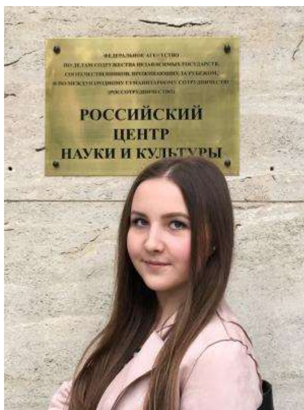
V ruském centru v Praze