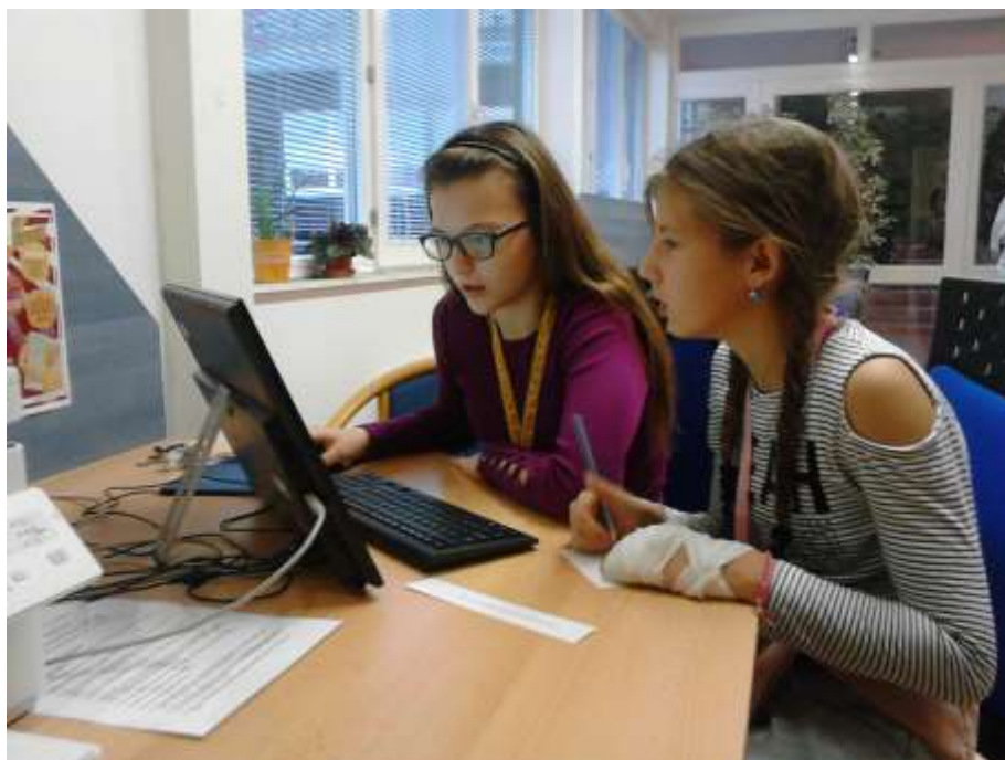
Primáni v Městské knihovně v Kojetíně