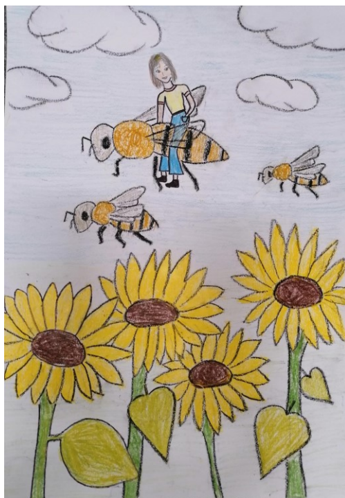
Autor: Klára Čížková, prima