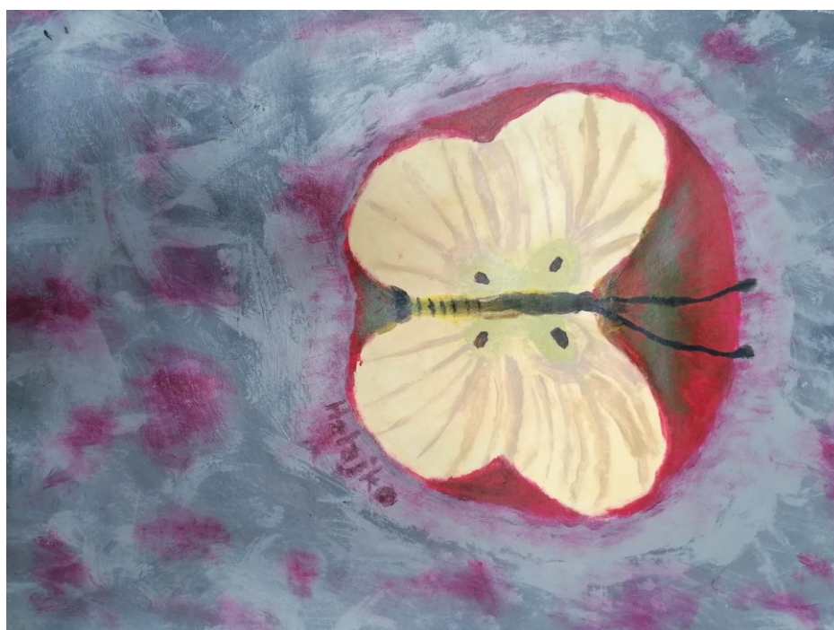
Autor: Filip Halajko, sexta