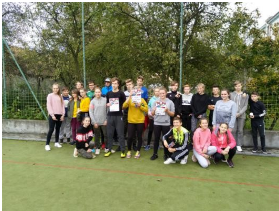
Turnaj v ringu byl jednou z částí projektu