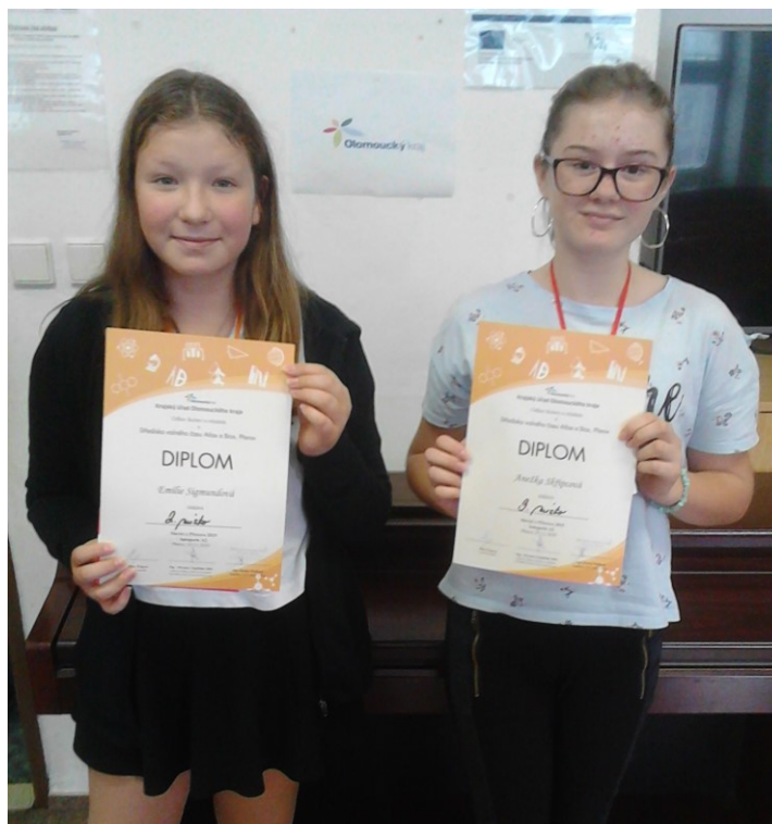
Vítězky z GKJ